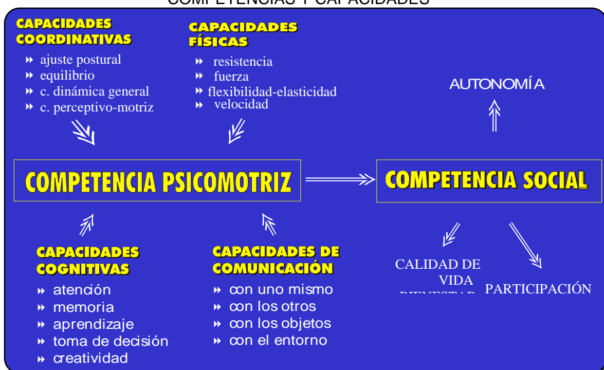
GRÁFICO Nº 1 COMPETENCIAS Y CAPACIDADES

La definición de competencia muestra aparentemente una confusión en el uso del término en su sentido amplio y restringido: “La competencia basada en principios de comportamiento se define como capacidades necesarias para demostrar conocimiento, destreza y adquisición de habilidad (ser competente)”. WINTERTON (2005). Sería un conjunto de comportamientos observables, repetibles respecto a determinados logros o dominios motrices.